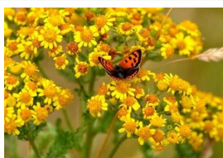
Small copper butterfly