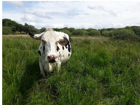
Cow grazing on marshy grassland