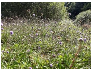
Marsh fritillary food plant - Devil's bit scabious