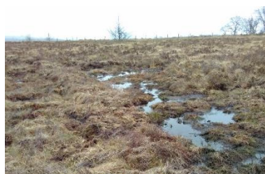
Water pooling behind a peat bund.