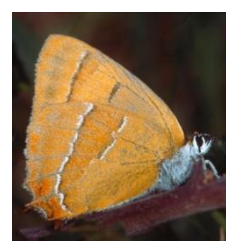
Brown hairstreak butterfly