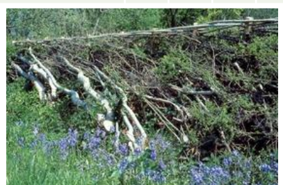
Dafen scrapes