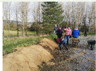
Bee bank at Sandy Water Park