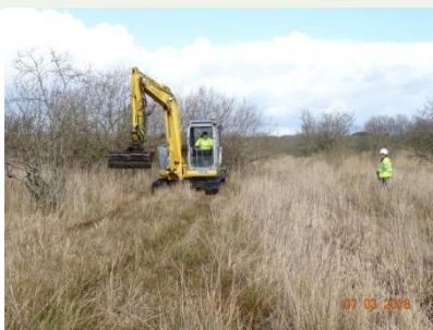
Management at Ffrwd Farm Mire