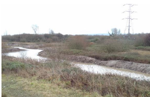
New ditch for water voles