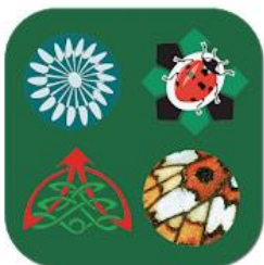
Mobile recording App