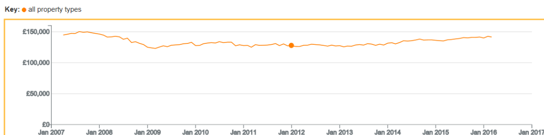
Ffigur 2 Pris cyfartalog: Cymru o fis Ebrill 2007 hyd at Fawrth 2016