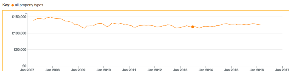
Ffigur 3 Pris cyfartalog: Sir Gâr o fis Ebrill 2007 hyd at Fawrth 2016