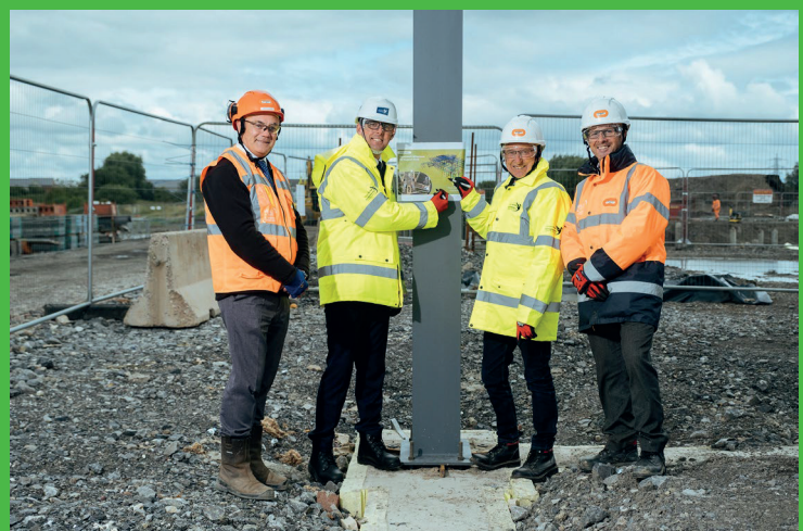
Members of Carmarthenshire County Council joined the Bouygues UK team to celebrate the commencement of the superstructure steel, a key milestone.

Habitat enhancement to edge of Dafen lake (October 2023 – March 2024)