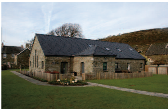
Perthynas rhwng yr adeilad a addaswyd a'i driniaeth ffiniau.

gwlad, dylid ymgorffori'r rhain mewn unrhyw gynllun.