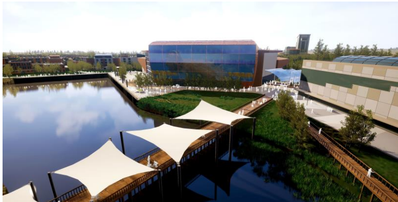
Delwedd o'r Pentref Llesiant a Gwyddorau Bywyd gwerth £200 miliwn sydd wedi'i gynllunio ar gyfer Llanelli

Mae rhaglen fuddsoddi gwerth £1.3 biliwn mewn 11 o brosiectau mawr ledled Dinas-ranbarth Bae Abertawe wedi cymryd cam mawr ymlaen.