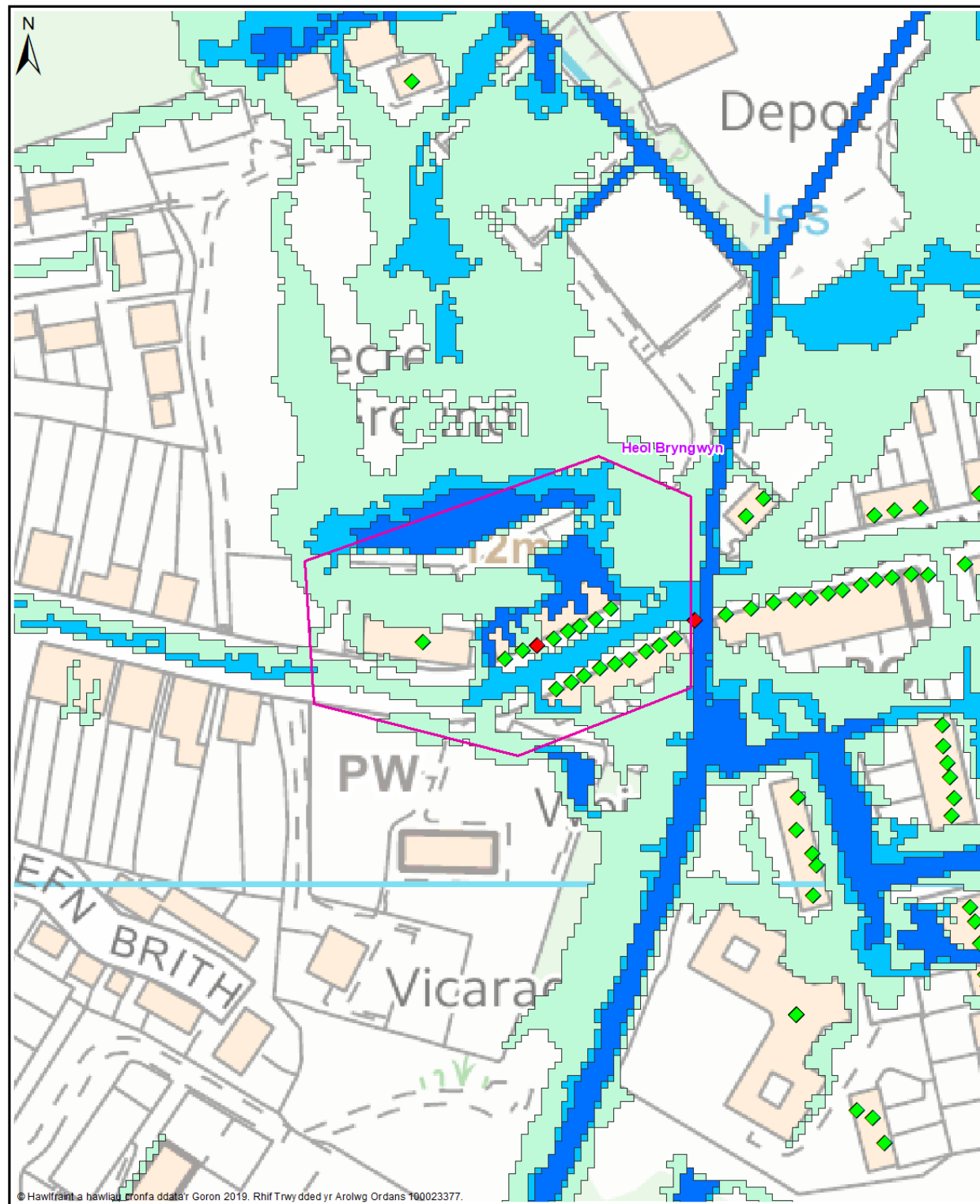
Map 3 - Cofrestr Cymunedau mewn Perygl