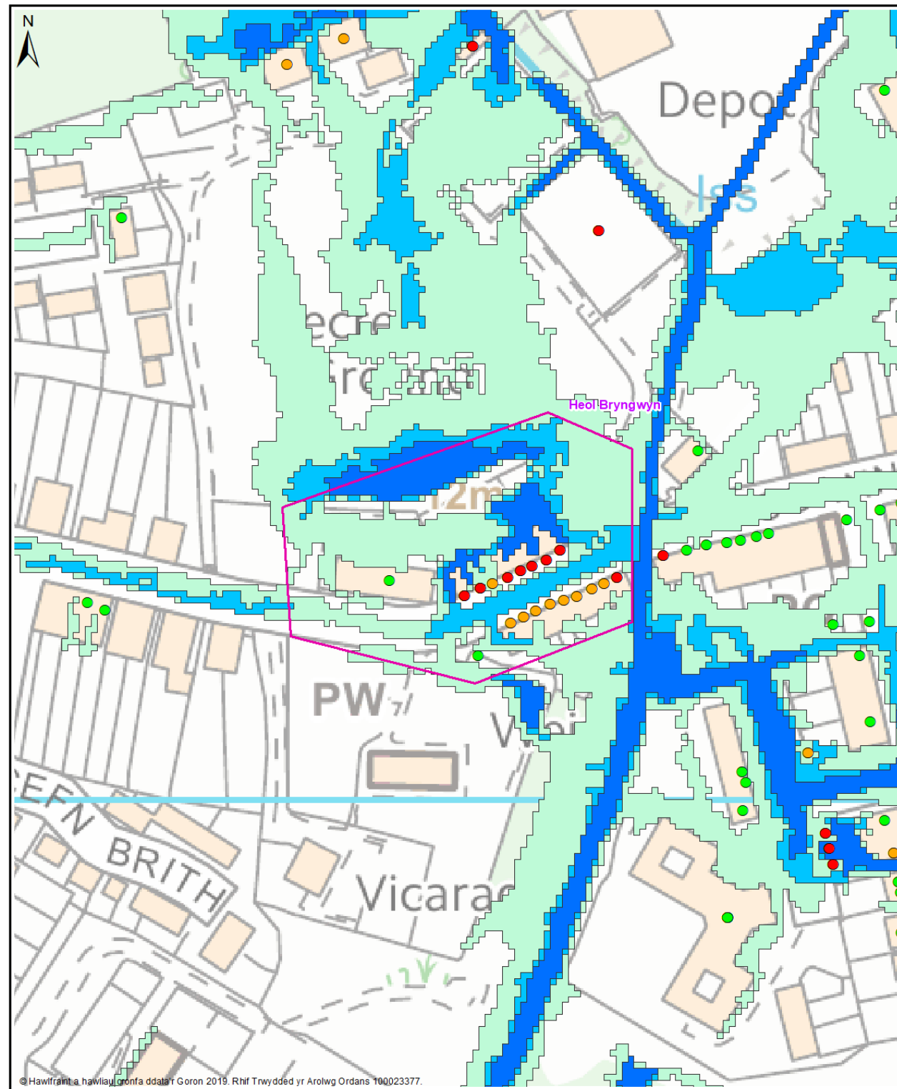
Map 1 - Pob eiddo Allwedd