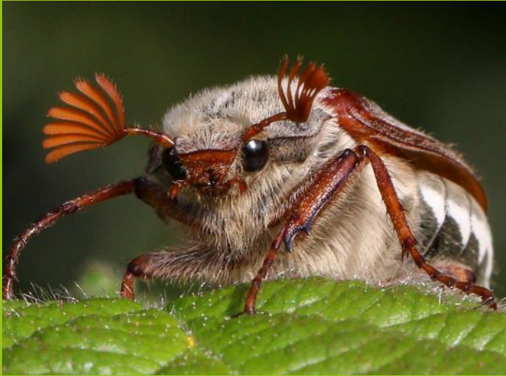
Chwilen y dom mewn gardd ym Mhump-hewl