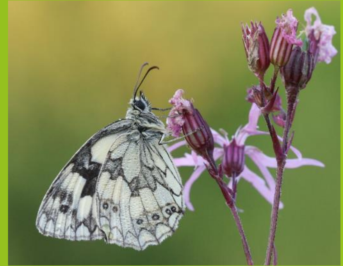
Glöyn gwyn cleisiog