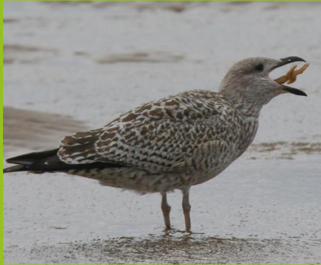
Gwylan ifanc gyda seren fôr ym Mhorth Tywyn