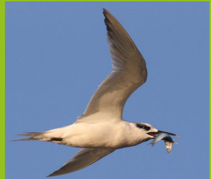
Môr-wennol bigddu yn hedfan gyda physgodyn yn ei cheg

Cafodd y lluniau hyfryd hyn eu hanfon i fewnflwch y Nodiadau Natur. Maent yn dangos yr amrywiaeth o fywyd gwyllt sydd wedi cael ei weld yn y sir yr haf hwn. Mae gennym ystod o gynefinoedd ac mae'r amrywiaeth o rywogaethau sydd gennym yn adlewyrchu hyn. Mae'r Nodiadau Natur yn gobeithio adlewyrchu hyn, ac mae lluniau'n helpu i adlewyrchu'r sir arbennig rydym yn byw ynddi.