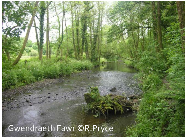
Gwendraeth Fawr