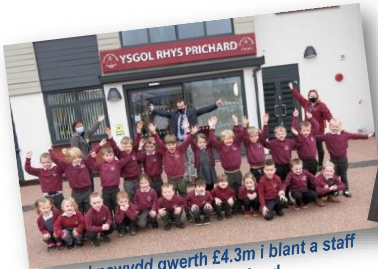
Ysgol newydd gwerth £4.3m i blant a staff Ysgol Rhys Prichard