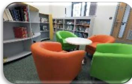
Buddsoddiad o £4.5m yn trawsnewid Ysgol Llangadog ar gyfer staff a disgyblion