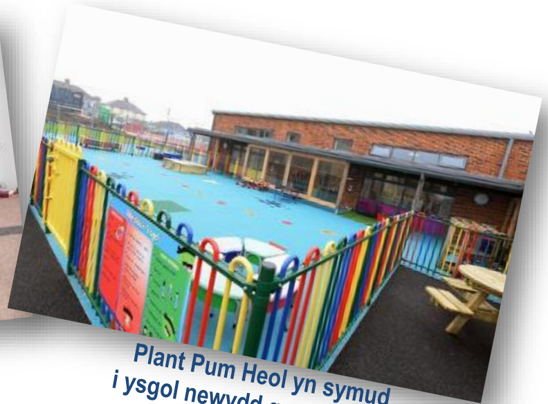
Plant Pum Heol yn symud i ysgol newydd gwerth £4.5m