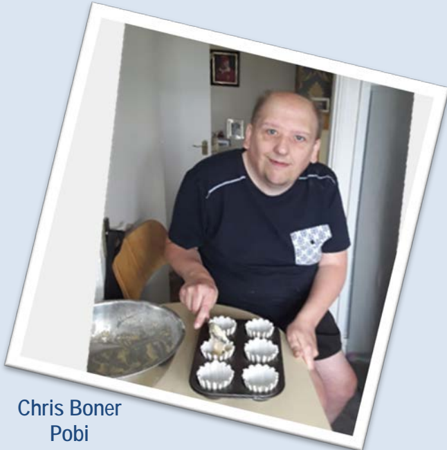
Chris Boner Pobi

Mae gweithgareddau wedi'u hehangu i roi "sgiliau bywyd" ychwanegol i ddefnyddwyr gwasanaeth. Er enghraifft, roedd gwersi coginio rhithwir hefyd yn ystyried elfennau o gynllunio bwydlenni, sut i siopa am gynhwysion, paratoi bwyd, coginio a glanhau.