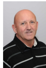
Cyng. Jeff Owen Ty-Isha (Plaid Cymru)